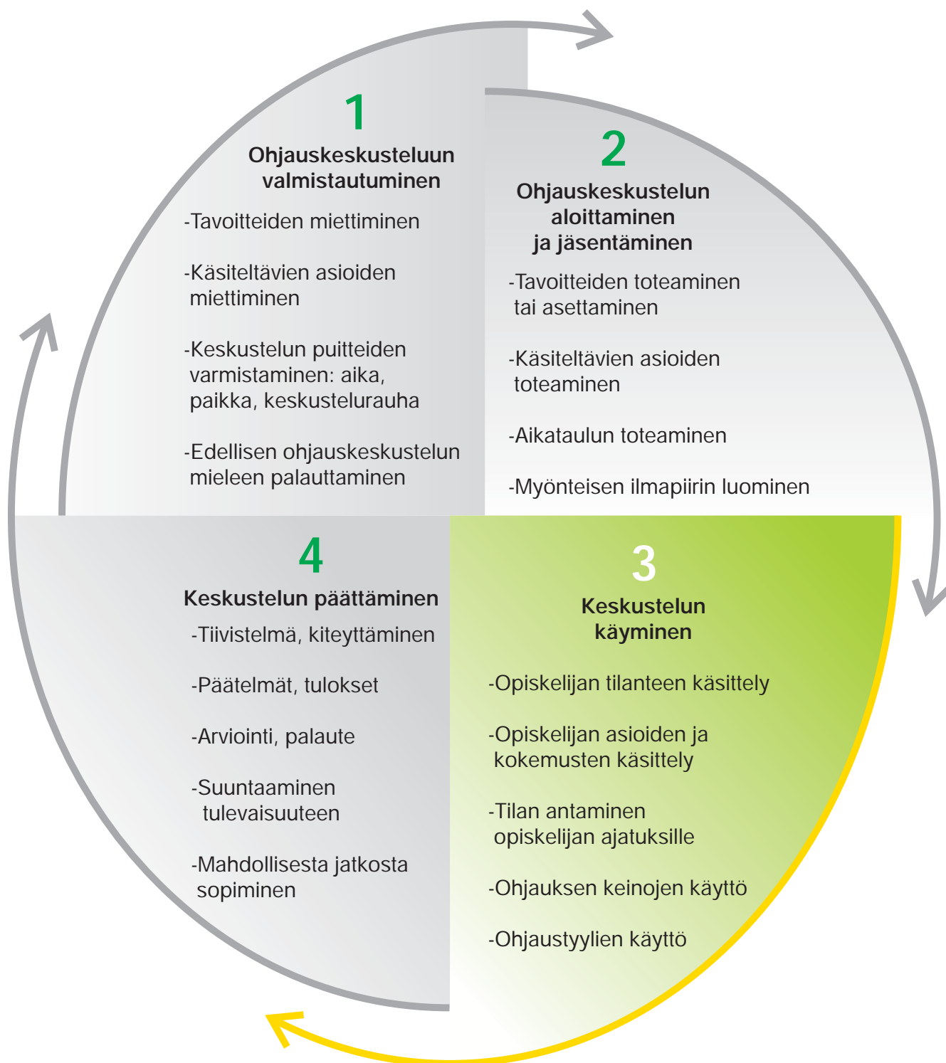
Kuvio 4. Ohjauskeskustelun vaiheet.